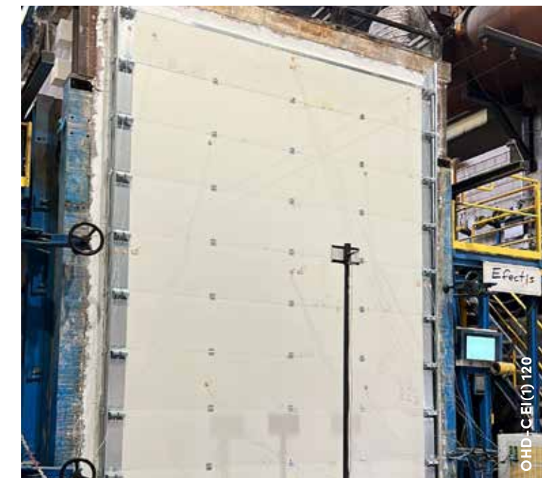
OHD-C EI(1) 120